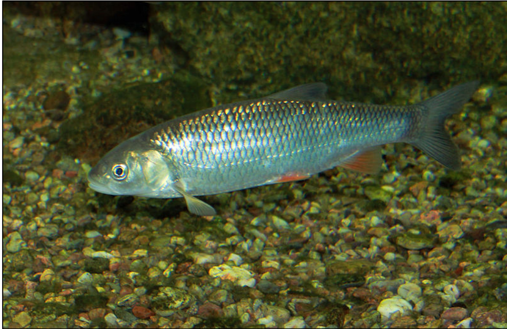
Fig. 3 - Chevesne ou Chevaine , Squalius cephalus