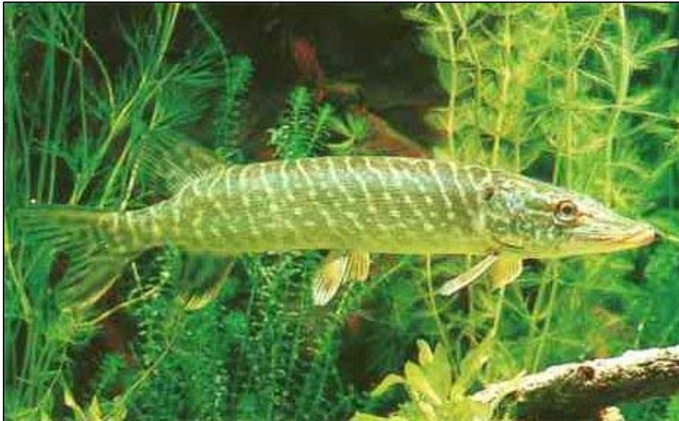
Fig. 7 - Grand brochet, Esox lucius