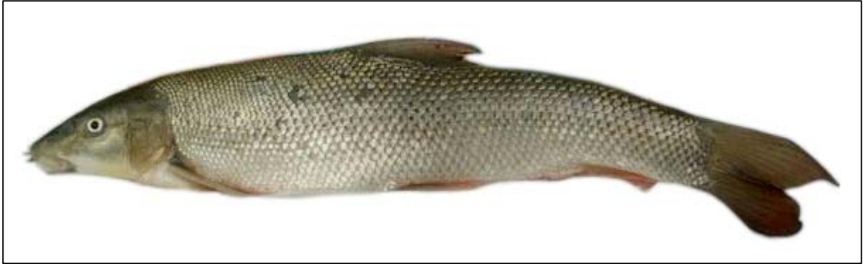
Fig. 1 - Barbeau, Barbus barbus