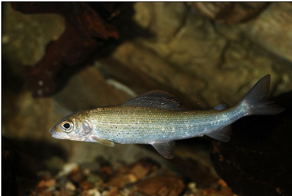
Fig. 6 - Ombre commun, Thymallus thymallus