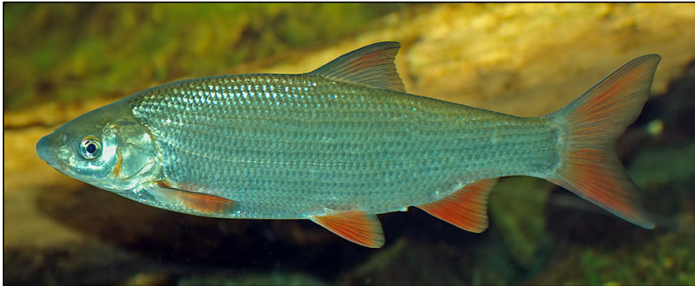
Fig. 2 - Hotu, Chondrostoma nasus