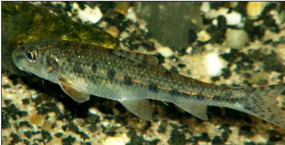
Fig. 4 - Goujon , Gobio gobio