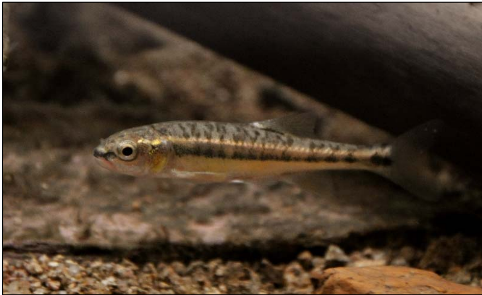
Fig. 5 - Vairon, Phoxinus phoxinus